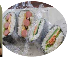
おにぎらずに挑戦