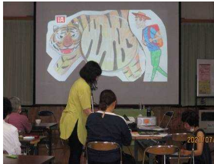
点子ちゃんズによる世界の絵本朗読