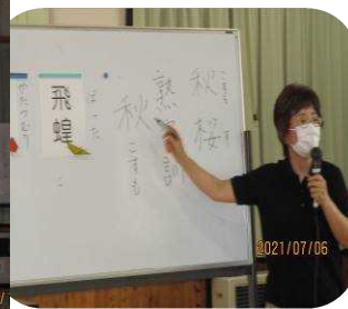
楽しい漢字のお話