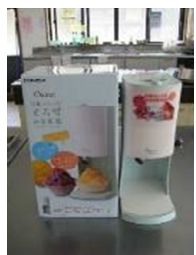
購入した冷凍ストッカーとかき氷器