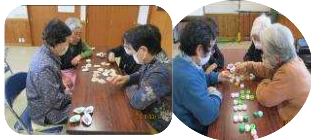
貝殻絵合わせやボトルキャップの言葉作り等 脳トレ&レクリエーション