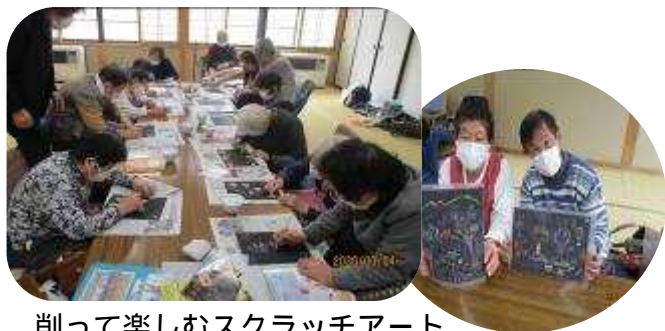
削って楽しむスクラッチアート

通常週2日開催のところ、今月は新型コロナウイルス感染拡大防止のため週1回とし、マスク着用での活動となりました。