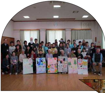
小学校 PTA さん とのクリスマス 交流会