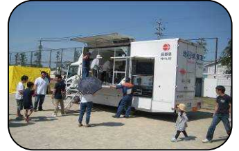
写真は昨年の様子

当日は旭ヶ丘地域づくり推進プロジェクトによる「ふれあい市」も開催され、野菜やお菓子などの販売も予定されています。