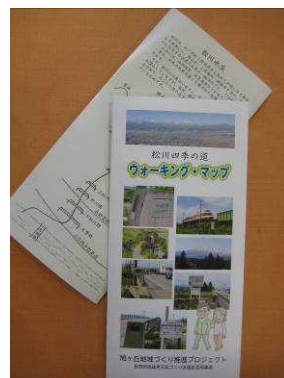
ウォーキングマップ