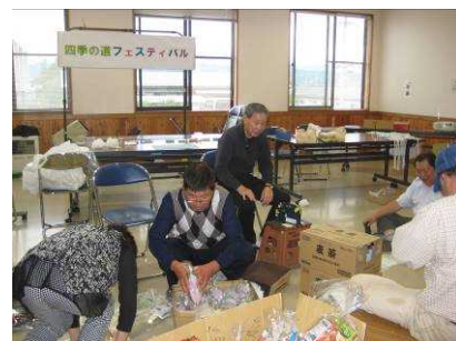
準備作業をするメンバー

『松川四季の道』は景観に優れ、散策やウォーキングなどに適したコースで、全面開通により今後は多くの利用が見込めます。皆さん健康増進や余暇利用などで利用してみたいかがでしょうか。