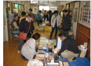
写真は昨年の様子です