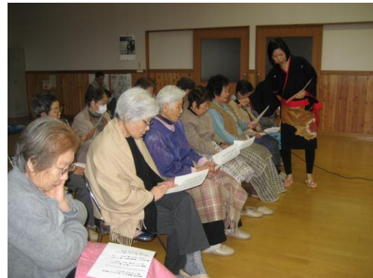
みなさん一緒に歌いました