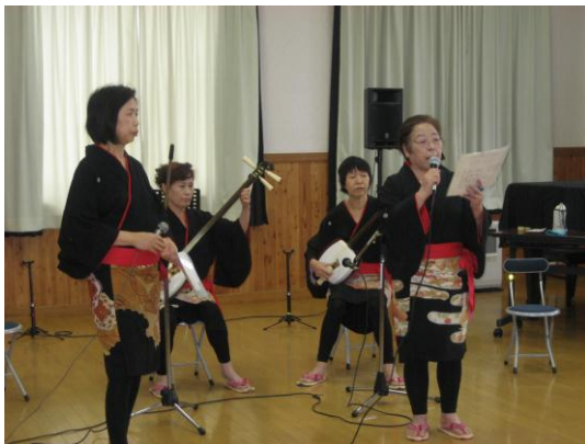
津軽三味線の生演奏に感動

※すこやかさんとは……市の生きがい活動支援通所事業である「すこやかふれあい広場」の会員の皆さんです。