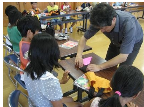
沢山の折り方を教わりました（折り紙教室）