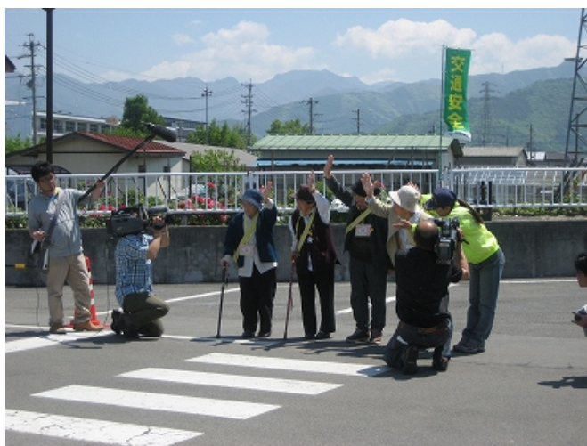
たくさんのカメラにみつめられて……

新聞社3社、テレビ局3社の取材が入り、すこやかさんの皆さんは少し緊張気味でした。