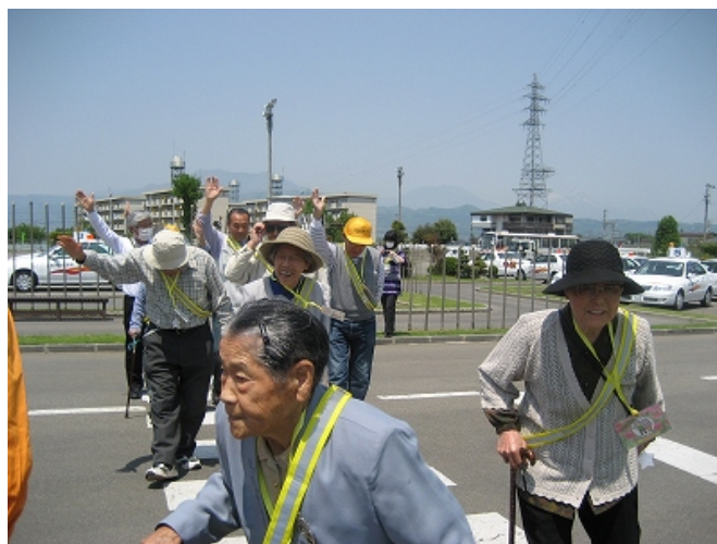
蛍光タスキを忘れずに