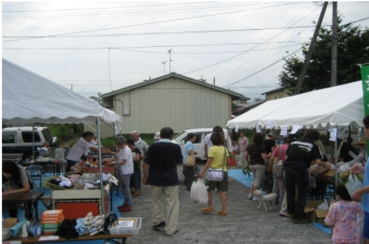
大盛況のふれあい市

酷暑の中汗だくになりながら、チーム員が一番心配していたことは、「お客さんがきてくれるかな」ということでした。ふれあい市の趣旨に賛同して商品を提供してくださったお店の品物はぜひ全部お買い上げいただきたいし、チーム員が直接仕入れた野菜や果物など鮮度が勝負の品物が売れ残るようでも困ります。(;_;) )