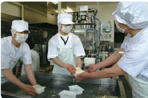
ワークハウスわらしべ