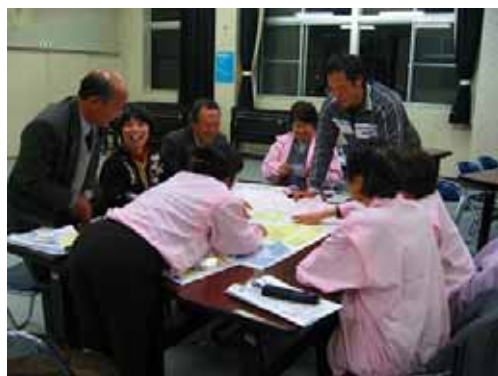
参加者全員でアイデアを出し合い、意見を分類分けします(イメージ写真)