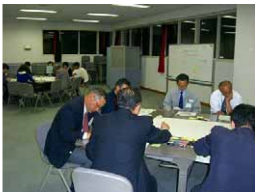
【健康・地域医療分科会の様子】