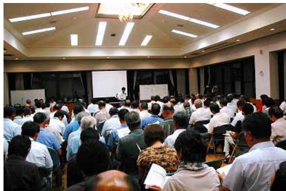
【8月26日開催 第1回 117人会議の様子】

同じく、須坂市公認地域ポータルサイト「いけいけすざか」の中のサービス「信州須坂いきいきブログ」( http://blog.suzaka.ne.jp/suzakacity?cat=609 )の中でも話し合いの経過を情報発信していきます。