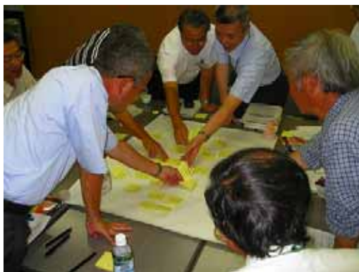
【まちづくり分科会の様子】