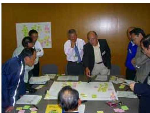
【産業分科会の様子】