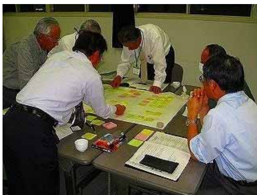
【行政経営分科会の様子】