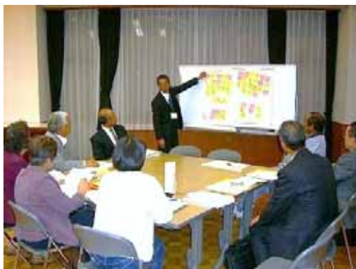
【共創分科会の様子】