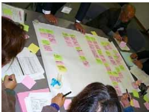
【子育て・教育分科会の様子】